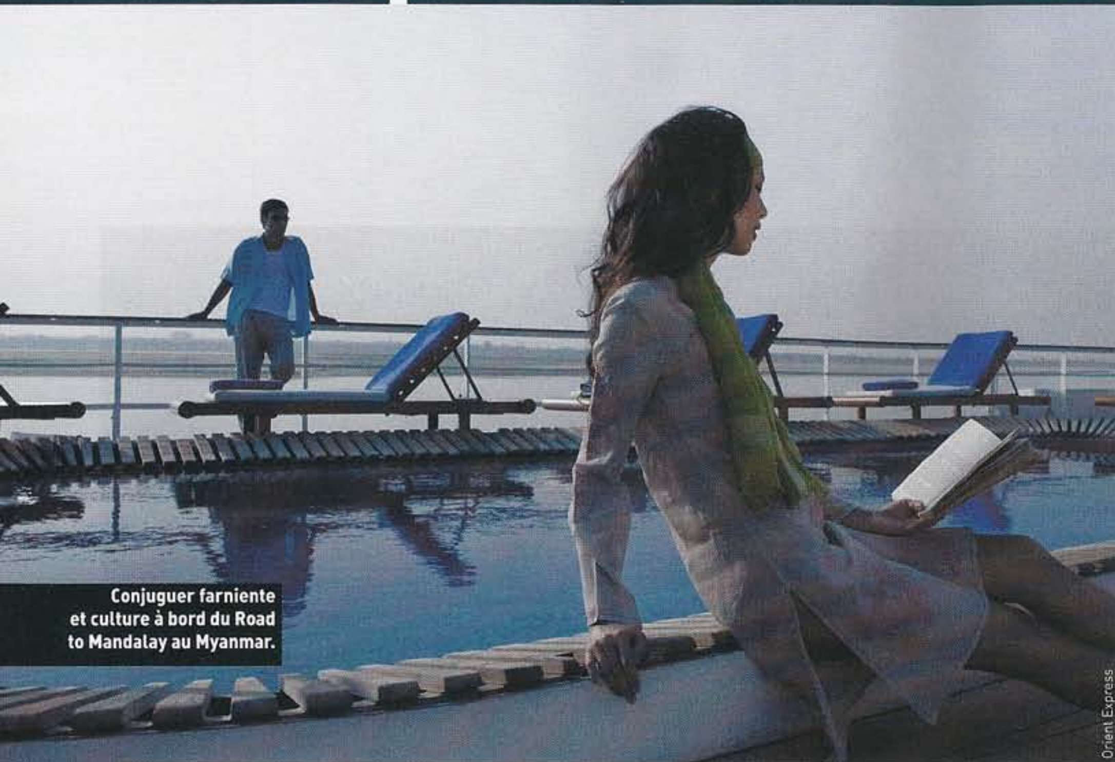
Conjuguer farniente et culture à bord du Road to Mandalay au Myanmar.