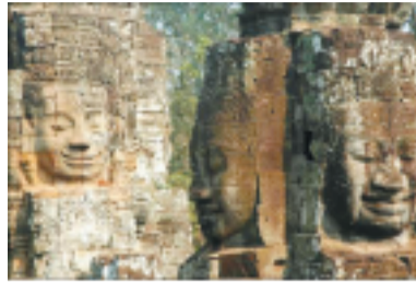
Le temple-montagne du Bayon

Palace privé. Niché dans un quartier paisible au sortir de la ville, à moins d'un kilomètre de l'entrée du site, le Samar Villas & Spa se veut plus comme une belle maison d'hôte que comme un hôtel tradi-