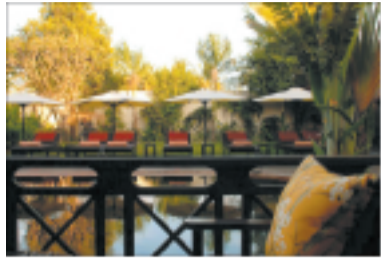
Le Samar Villas & Spa

« DES BASILIQUES fantômes, immenses et imprécises, ensevelies sous la forêt », écrivait Pierre Loti, impressionné par les regards des monumentaux visages de pierre aux sourires figés du Bayon, alors que le temple était encore noyé de cascades végétales. Après plus d'un siècle, la magie subsiste devant le spectacle des centaines de temples du site émergeant de la jungle, parmi lesquels le majestueux Angkor Vat dévoile ses cinq tours mythiques nimbées de rose dans les premières lueurs de l'aube. Ou encore Angkor Thom, l'ancienne capitale impériale, avec les ruines de son palais royal, le temple-montagne Baphuon, centre spirituel des anciens Khmers, et l'envoûtant Bayon et sa forêt de 54 tours, chacune ornée de quatre énigmatiques et gigantesques visages de pierre dont la sérénité illustre les vertus de Bouddha.