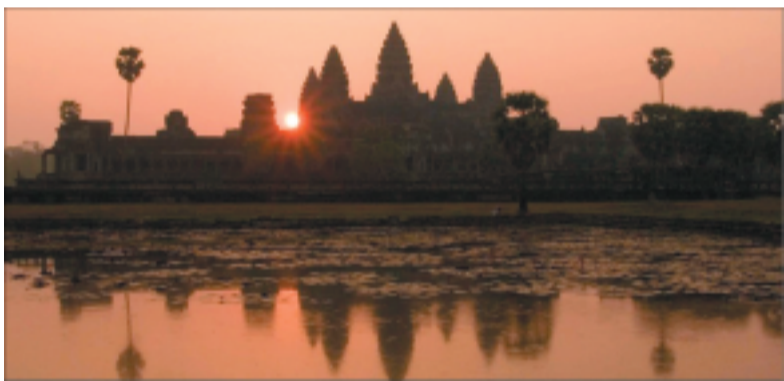
Angkor Vat et ses tours