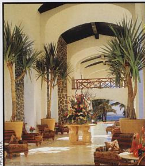
Chic tropical au Saint-Géran.